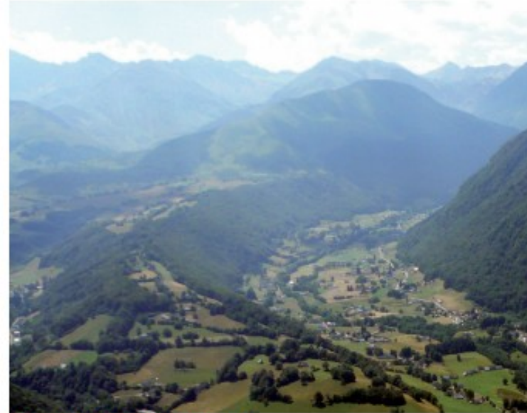
© Haut Val d'Adour, Alix années 1950 ; Haut Val d'Adour, Béringuier 2008